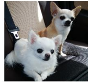
ひめちゃん うらちゃん