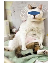
👉 お腹のハゲとか怪しいサインです

ネコも血液検査でアレルギー検査がやっとできるようになりました。そうなんです。去年までなかったんですよ。顔の周りのぶつぶつ、お腹の舐めこわしや脱毛、週に1回以上吐きグセ（通常、吐きグセというのはありません。大抵病気。）はアレルギーの可能性がります。お薬や注射で様子を見る、食事を変えてみる、虫下しを試してみるなどで少し変わってくるはずですが、その前にネコさんの血液検査をしてみると、実はアレルギーだった、というのが分かるかもしれません。必要日数1週間くらい。費用16200円。土曜日以外受付可。です。