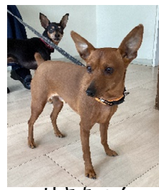
リキちゃん テツちゃん